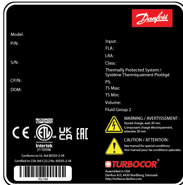
图 2 - 主压缩机铭牌