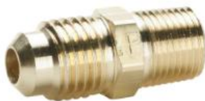
图 2 - 安装示例